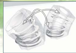
Oscillazioni a 360°